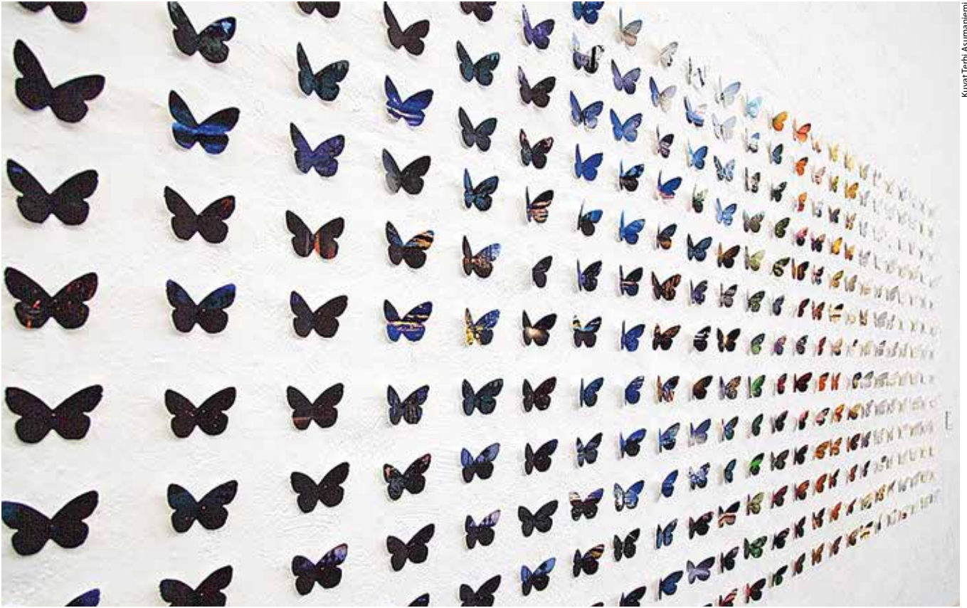
Perhosvaikutus. 2019-2020. Pigmenttivedos Hahnemühle Photo Rag-paperille. Teräsneula.