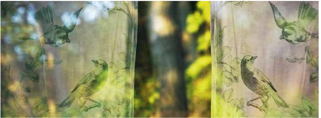
Silent Fall. 2018. Pigmenttivedos William Turner paperille.