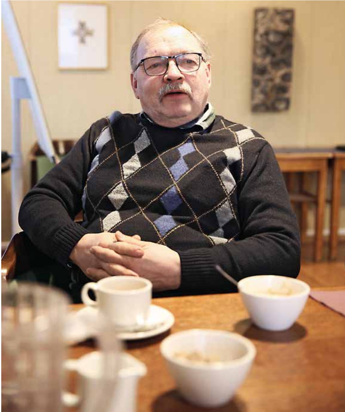
”Olen yrittänyt pitää vähän puhelinta kiinni tai yrittänyt sanoa, että meillä on vasta tää demovaihe menossa, että katsotaas nyt.”