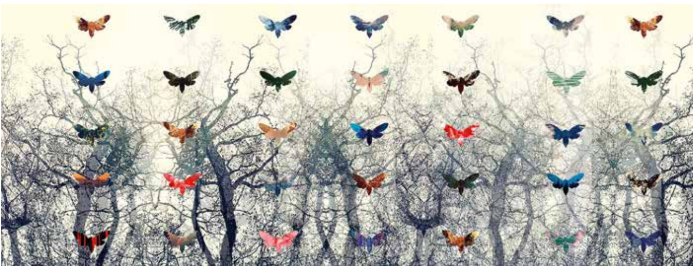
Cicada Principle. 2022. Pigmenttivedos William Turner paperille. 60x140 cm.