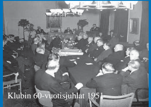
Klubin 60-vuotisjuhlat 1951