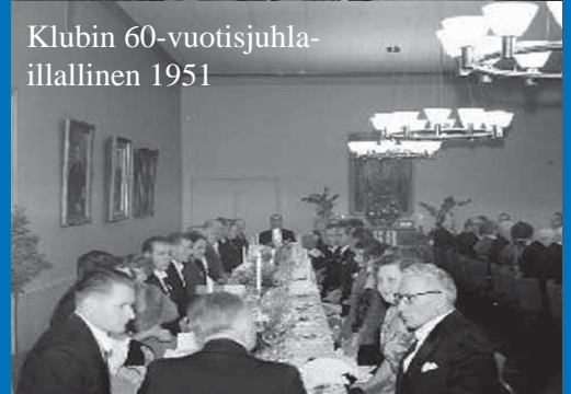
Klubin 60-vuotisjuhla-illallinen 1951