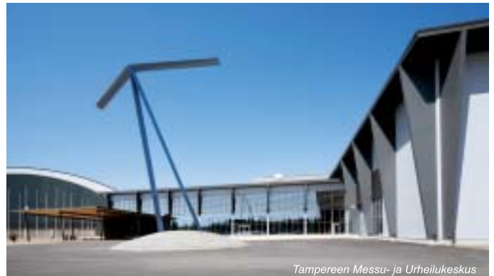
Tampereen Messu- ja Urheilukeskus