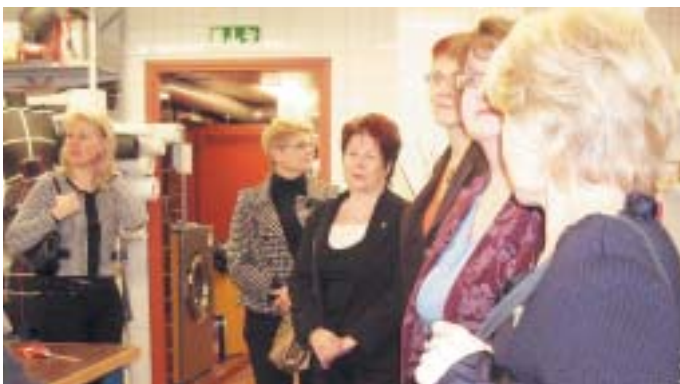
Klubinaiset vierailivat tammikuussa Työväen Teatterin näyttämön takana.