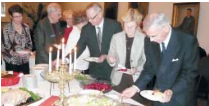
Ruutiukkoja daameineen joululounaalla.