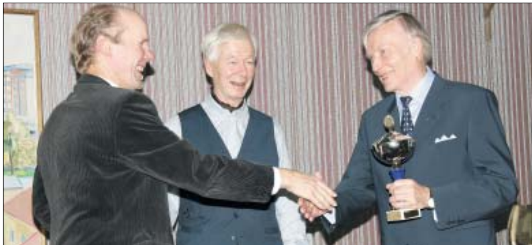
Klubilaisilla on iloiset ilmeet, kun molemmat kiertopalkinnot saatiin Klubi - Kauppaseura -turnauksesta omaan kaappiin. Herrojen Hokkanen, Nyrjä, Repo aikana on Klubille tullut kahdessa vuodessa kolme biljardin SM-kultaa.

Päivärinta, Eeva 1999: Kohti kolmatta ikää. Gialogi 4.