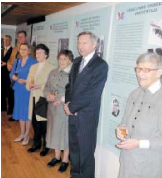
Omia lottia ja kutsuvieraita näyttelyn avajaisissa.