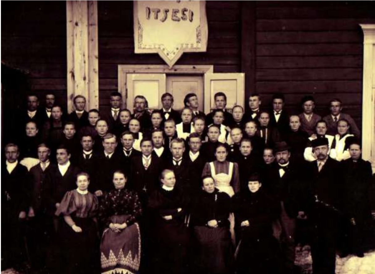
Kymenlaakson kansanopiston opettajia ja oppilaita

erilaisissa tilaisuuksissa ja kansanvalistustyöhön opiston vaikutusalueella. Sippolan kunnan historiassa kirjoitetaan: