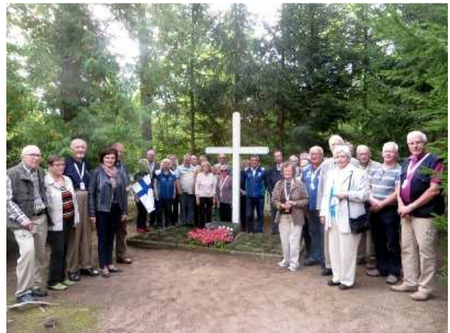
Perinnematkalaiset Bejan hautausmaalla 2016.