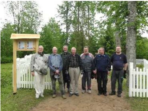
Talkooryhmä Bejan hautausmaalla vuonna 2012.

Marienburgin taistelu käytiin 21. helmikuuta 1919. Bolševikit ajettiin pois kaupungista. Suomalaisia kaatui 25 ja haavoittui noin 90. Kaksi päivää myöhemmin pieni osa Pohjan Pojista taisteli Marienburgin itäpuolella olevassa Bejan kylässä. Suomalaisia kaatui tässä taistelussa yhdeksän. Bejassa on seitsemän kaatuneen suomalaisen sankarihauta, jota Bejan koulu ja asukkaat hoitavat. Hautausmaan perusparannukseen ovat myös osallistuneet Vapaussodan Tampereen Seudun Perinneyhdistyksen talkoolaiset.