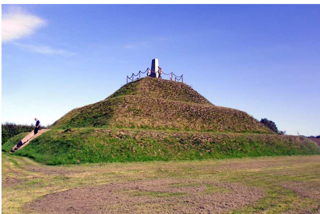
Pajun taistelun mahtava muistomerkki.

Valgan kaupunki vallattiin seuraavana päivänä helposti. Pari viikkoa myöhemmin vallattiin parikymmentä kilometriä Valgasta kaakkoon sijaitseva Koikküla.