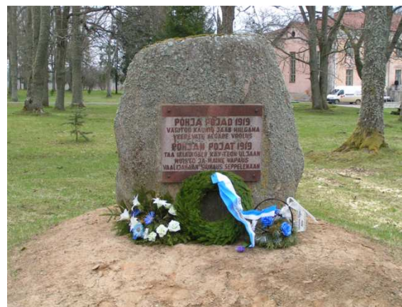
Muistokivi Pajun kartanon pihassa.